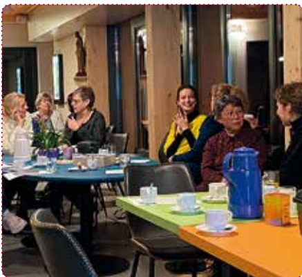
In gesprek bij de St. Bonifatius parochie te Almere

Na de inleiding is er gelegenheid tot het stellen van vragen en gedachtewisseling.