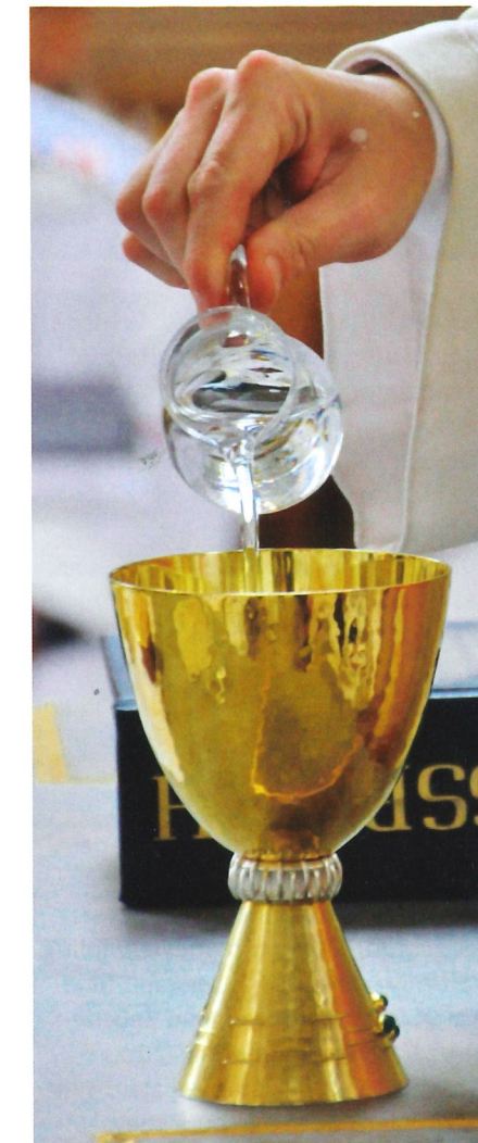
“Water en wijn worden één. Gij deelt ons menszijn en neemt ons op in uw goddelijk leven.”

Christus is verrezen en opgevaren ten hemel, zoals we geloven volgens artikel 5 en 6 van de Geloofsbelijdenis. Door de Eucharistie mogen wij daar deel aan hebben, want we vormen allen tezamen één lichaam. Dat lichaam is al verrezen en kent een eeuwig leven. Zolang wij hier op aarde zijn, met al onze zwakheden, tekorten en twijfels, kunnen we daarvoor bidden, ook in de Eucharistie. Bijvoorbeeld met het vierde eucharistische gebed, waarin oorsprong en einde samenkomen: “Barmhartige Vader, verleen aan ons, uw kinderen, dat wij de heerlijkheid zien die Gij ons beloofd hebt, tezamen met de maagd Maria, de Moeder van God, die Gij hebt verheerlijkt, met de heilige Jozef, haar bruidegom, met uw