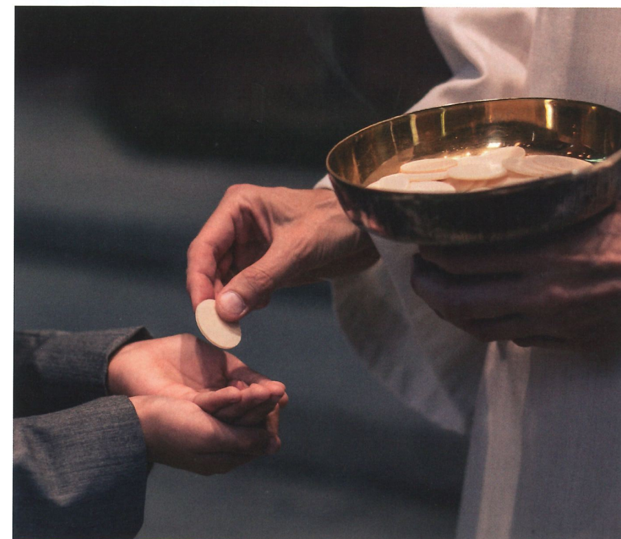
Door de Communie is Christus in ons

In de meeste eucharistische gebeden wordt in de tweede epiklese gevraagd om versterking van de eenheid van de geloofsgemeenschap (“breng ons elkaar nabij”), een bede die aansluit bij die ene grote wens van Christus, uitgesproken in zijn indrukwekkende gebed tot de Vader: “Ik heb hun de heerlijkheid gegeven die Gij Mij geschonken hebt, opdat zij één zijn zoals Wij één zijn: Ik in hen en Gij in Mij, opdat zij volmaakt één zijn (Johannes 17, 22). De verzen Christus schenkt zichzelf in de eucharistie; door de communie is Hij in ons, dankzij de kracht van de Geest, die door de Vader is gezonden.