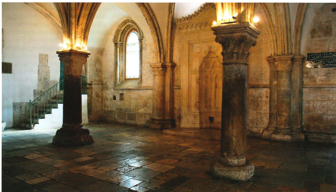
De Bovenzaal (het Cenakel) van Jezus laatste avondmaal.

De gehele viering is een belijdenis van ons geloof, maar ook elk klein moment van de eucharistieviering: van binnenkomst en ontvangst tot zegen en wegzending. Hieronder kunt u lezen over het vijfde en zesde geloofsartikel in relatie tot de viering van de Eucharistie.