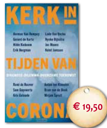
Kerk in tijden van corona (2020) Diverse auteurs. Samengesteld door Leo Fijen

Na meer dan een halfjaar in de ban van het coronavirus wil ik het woord 'corona' niet meer horen. Toch vond ik het lonend om deze nieuwe bundel te lezen, want de essays die erin opgenomen zijn, kijken allemaal verder dan de voorbijgaande situatie. De auteurs laten elk op hun eigen wijze zien hoe de crisis fundamentele vragen blootlegt.